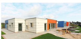
Investorenmodell: 5-Gruppen Kita in Korschenbroich