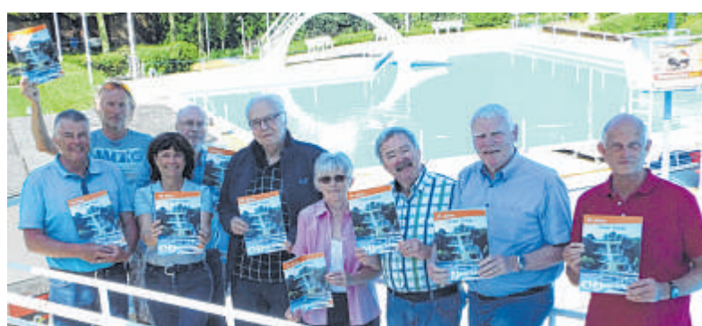
Mitglieder der Vereine Volksbad Marl und Lauftreff Guido haben die Festschrift erarbeitet.

Zum Saisonauftakt erscheint eine Festschrift, die von den Vereinen Volksbad Marl und Lauftreff Guido gemeinsam erstellt wurde. Die Chronik wird zum Wochenende hin an die Haushalte in Alt-Marl und Polsum verteilt. Wer ansonsten Interesse an der Broschüre hat, kann sie nach Pfingsten gegen eine Schutzge-